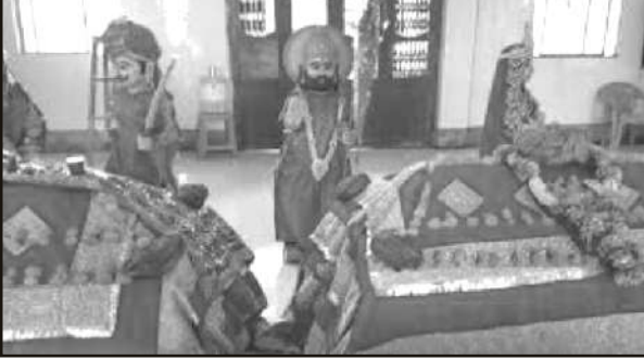
જેસલ-તોરલ સમાધિ, અંબાર-કચ્છ.

કચ્છની અંદર જૈન અતિથિગૃહ અને ભોજનશાળાઓનો વહીવટ સુચારુ ચાલતો હોવાથી અહીં સ્વચ્છ વાતાવરણ તેમજ ભોજનશાળામાં શુદ્ધ વ્યંજનો પિરસવામાં આવે છે, શિવમસ્તુ તીર્થના રસોડામાંથી ગરમા-ગરમ દાળ અને રોટલીની સોડમ પેટમાં કુરકુરીયા બોલાવવા લાગી તેથી યાત્રિકોને જમવા પધારવા ત્યાંના મેનેજરશ્રીએ આહ્વાન કર્યું.