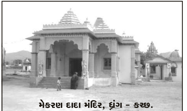
મેકરણ દાદા મંદિર, ઘુંગ - કચ્છ.